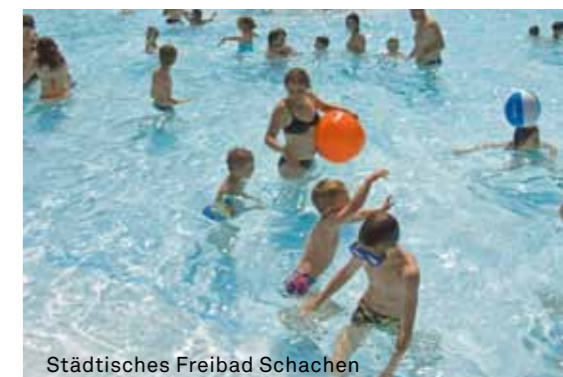
Städtisches Freibad Schachen