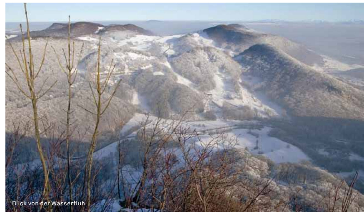
Blick von der Wasserfluh