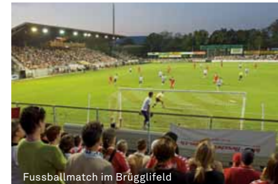
Fussballmatch im Brügglifeld

Ob Aktivsportler/-innen oder Zuschauer/-innen: In Aarau kommen alle auf ihre Kosten.