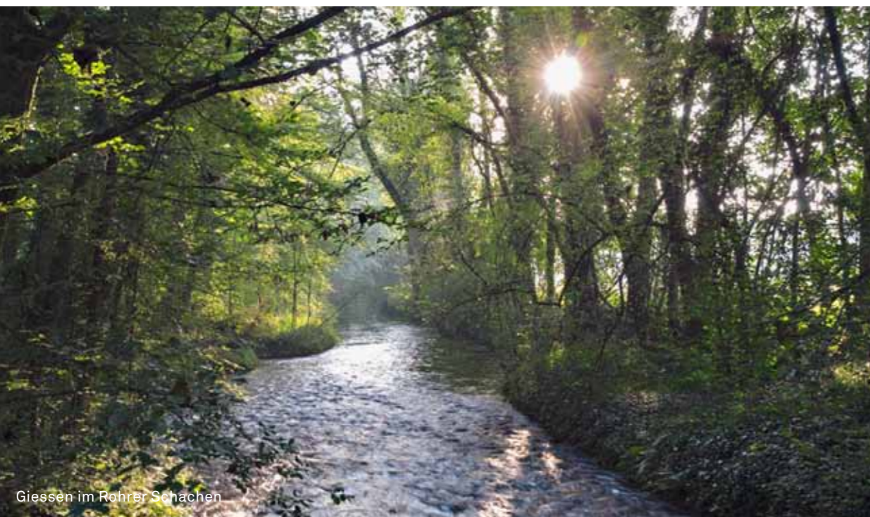
Giessen im Rohrer Schachen