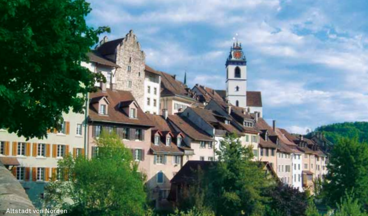
Altstadt von Norden