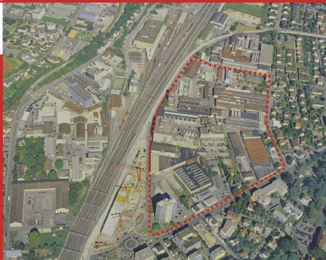
Luftbild des Planungsgebietes Torfeld Süd

(gegen den Beschluss kam innerhalb der gesetzlichen Frist das Referendum zustande)