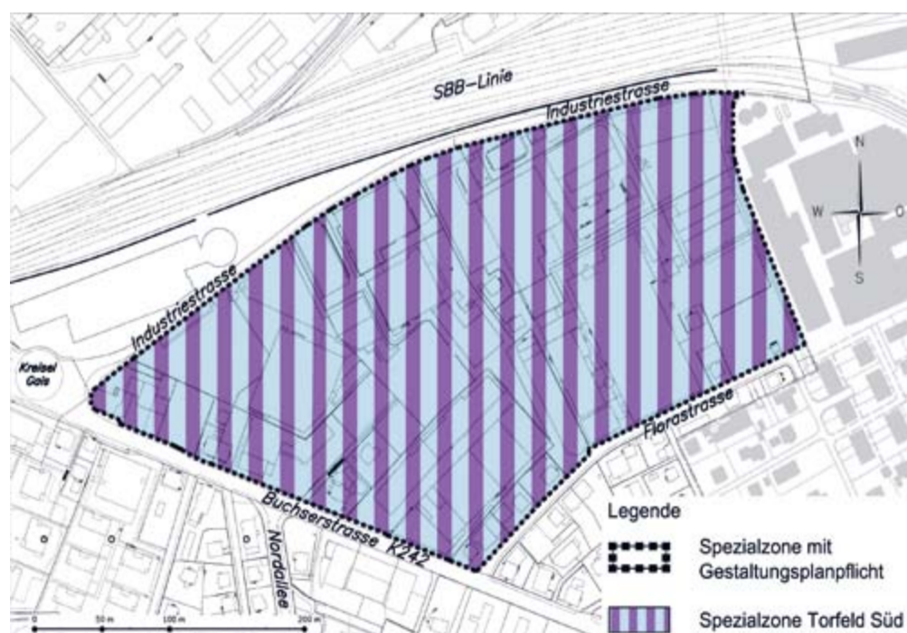
Teilrevision des Zonenplans im Gebiet Torfeld Süd – anstelle der Industriezone wird neu die Spezialzone mit Gestaltungsplanpflicht festgelegt.

Insgesamt fand der Erlass des § 30 ter BNO und mit diesem die Gebietsplanung Torfeld Süd im Einwohnerrat breite Unterstützung. Die Planungsziele des Stadtrates wurden als sachgerecht und richtig erachtet. Die Zonenplanänderung und die Ergänzung der BNO wurden in der Folge mit grosser Mehrheit (35 Ja- : 2 Nein-Stimmen bei 9 Enthaltungen) gutgeheissen.