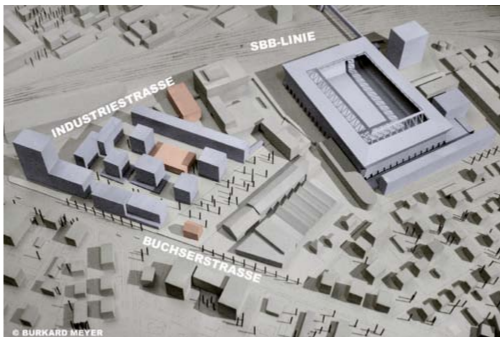
Beabsichtigter Entwicklungsschritt im Gebiet Torfeld Süd (blau: neue Gebäude / rot: zu erhaltende Gebäude / grau: bestehende Gebäude).