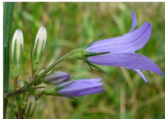
Rapunzel-Glockenblume Campanula rapunculus