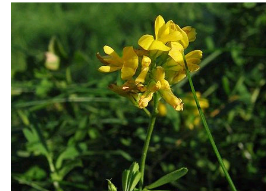
Sichelklee Medicago falcata