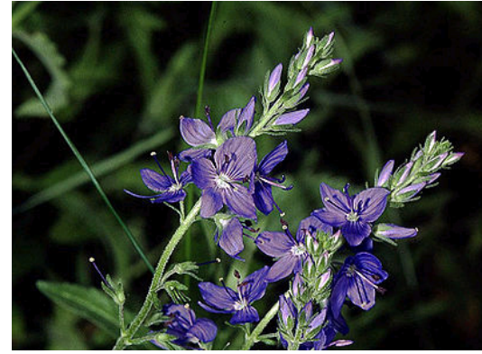
Gamanderartiger Ehrenpreis Veronica teucrium