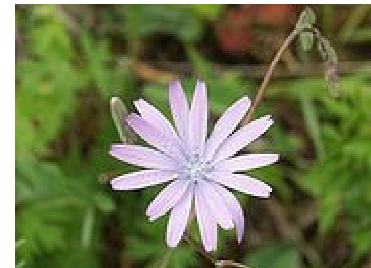
Blauer Lattich Lactuca perennis