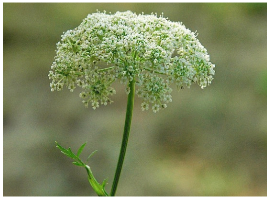
Hirschheil Seseli libanotis