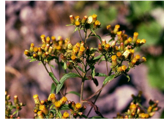
Gewöhnlicher Alant Inula conyza