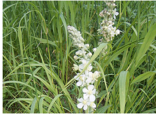
Mehlige Königskerze Verbascum lychnitis