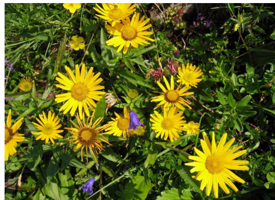
Weidenblättriges Ochsenauge Buphthalmum salicifolium