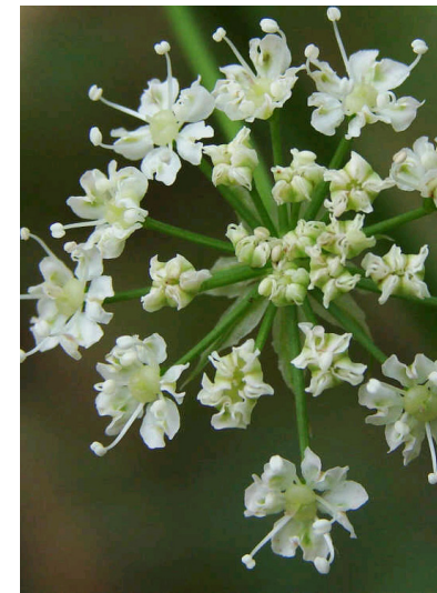
Berg-Laserkraut Laserpitium siler