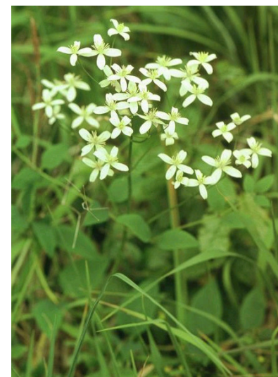
Aufrechte Waldrebe Clematis recta