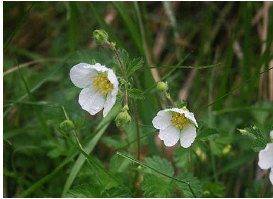
Felsen-Fingerkraut Potentilla rupestris