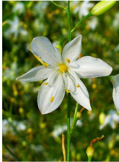
Ästige Graslinie Anthericum ramosum