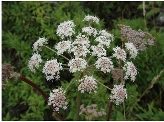
Hirschwurz Peucedanum cervaria