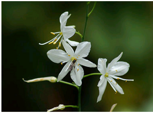
Astlose Graslinie Anthericum liliago