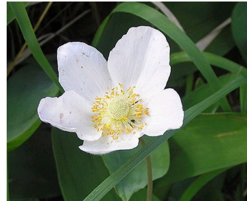
Grosses Windröschen, Anemona sylvestris

Realisation: Umweltfachstelle Aarau, umweltfachstelle@aarau.ch