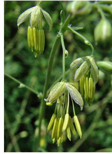
Kleine Wiesenraute Thalictrum minus