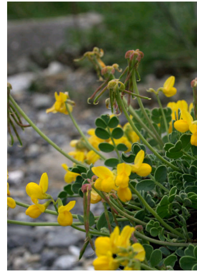
Berg-Kronwicke Coronilla coronata