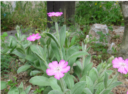
Jupiter Lichtnelke Silene flos-jovis