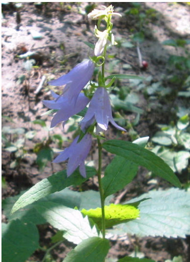
Acker-Glockenblume Campanula rapunculoides