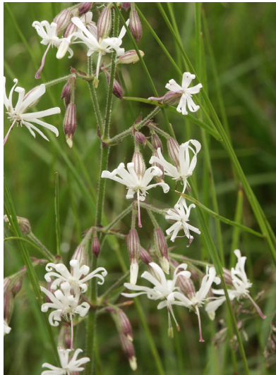
Nickendes Leimkraut Silene nutans