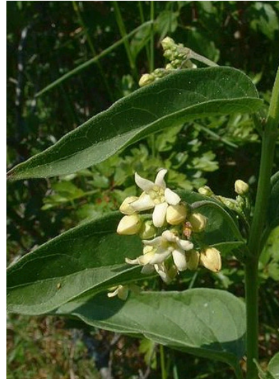
Schwalbenwurz Vincetoxicum hirundinaria