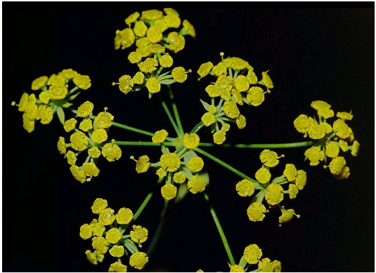
Sichelblättriges Hasenohr Bupleurum falcatum