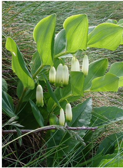
Echtes Salomonssiegel Polygonatum odoratum