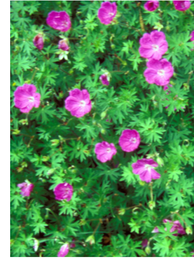
Blutroter Storchschnabel Geranium sanguineum