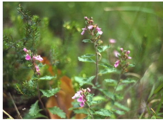
Edel-Gamander Teucrium chamaedrys