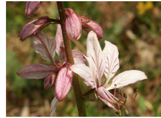
Diptam Dictamnus albus