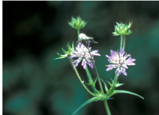
Wald-Witwenblume Knautia dipsacifolia