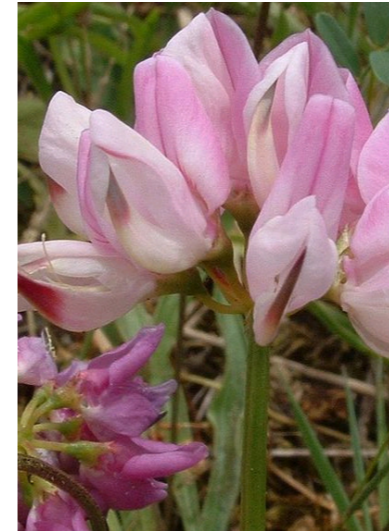
Bunte Kronwicke Securigera varia