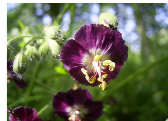
Brauner Storchschnabel Geranium phaeum