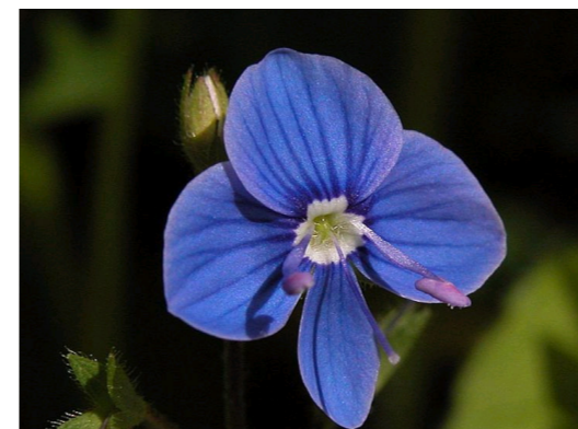
Gamander Ehrenpreis Veronica chamaedrys