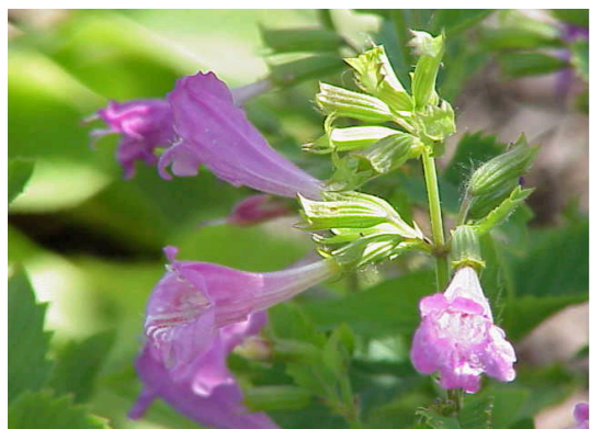
Echte Bergminze Calamintha mentifolia