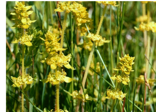
Gewöhnliches Kreuzlabkraut Cruciata laevipes