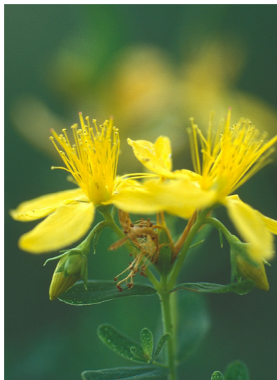
Echtes Johanniskraut Hypericum perforatum