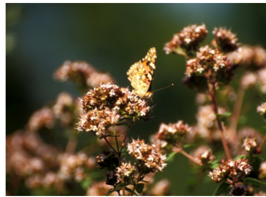
Dost Origanum vulgare