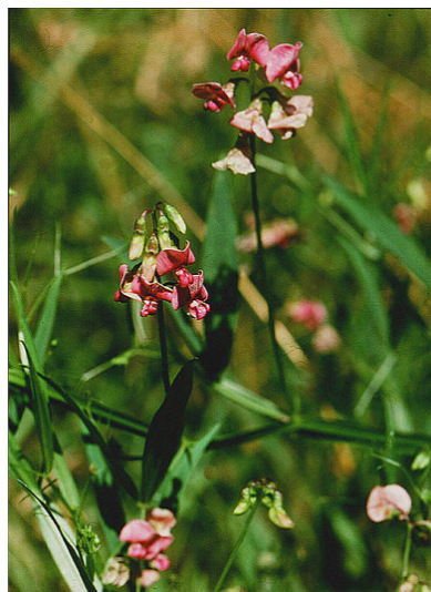
Wald-Platterbse Lathyrus silvestris