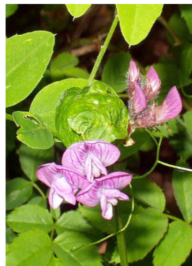
Hecken-Wicke Vicia dumetorum