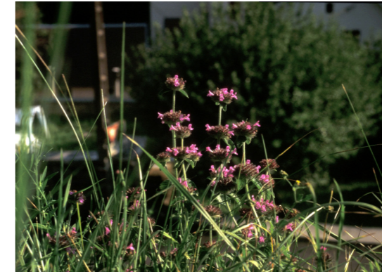
Wirbeldost Clinopodium vulgare