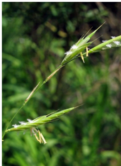
Fiederzwenke Brachipodium pinnatum