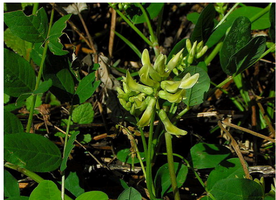
Süsser Tragant Astragalus glycyphyllos