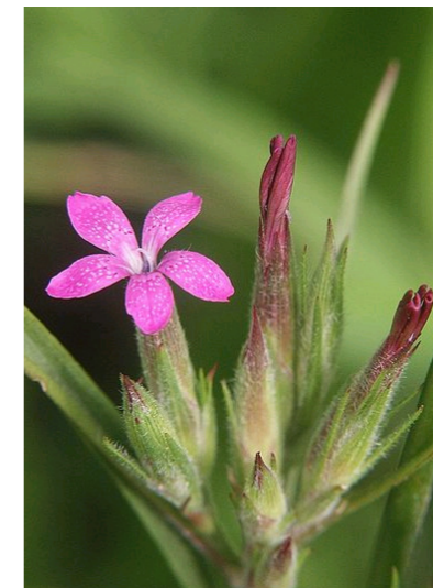
Rauhe Nelke Dianthus armeria