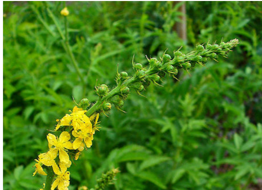
Wohlriechender Odermenning Agrimonia procera