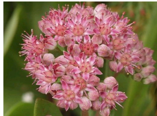
Grosses Fettkraut Sedum telephium