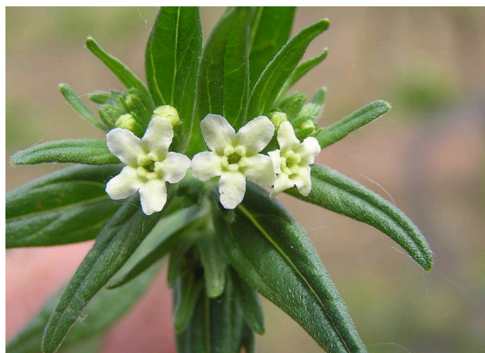
Echter Steinsamen Lithospermum officinale