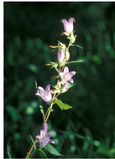
Nesselblättrige Glockenblume, Campanula trachelium