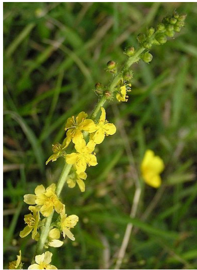
Gemeiner Odermenning Agrimonia eupatoria