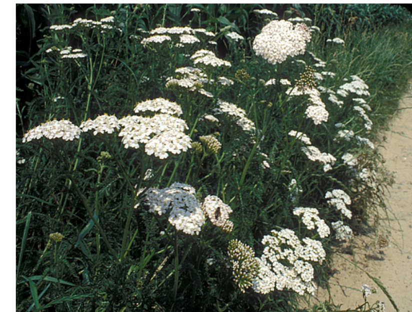
Gemeine Schafgarbe, Achillea millefolium

Realisation: Umweltfachstelle Aarau, umweltfachstelle@aarau.ch