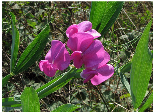
Breitblättriges Platterbse Lathyrus latifolius