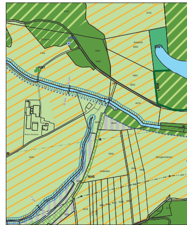
Rechtsgültiger Bauzonen- und Kulturlandplan Ost RRB Nr. 2019-001549 vom 18. Dezember 2019 (orientierend)

Wald Gewässer / Gewässer eingetrot Hochspannungslinie