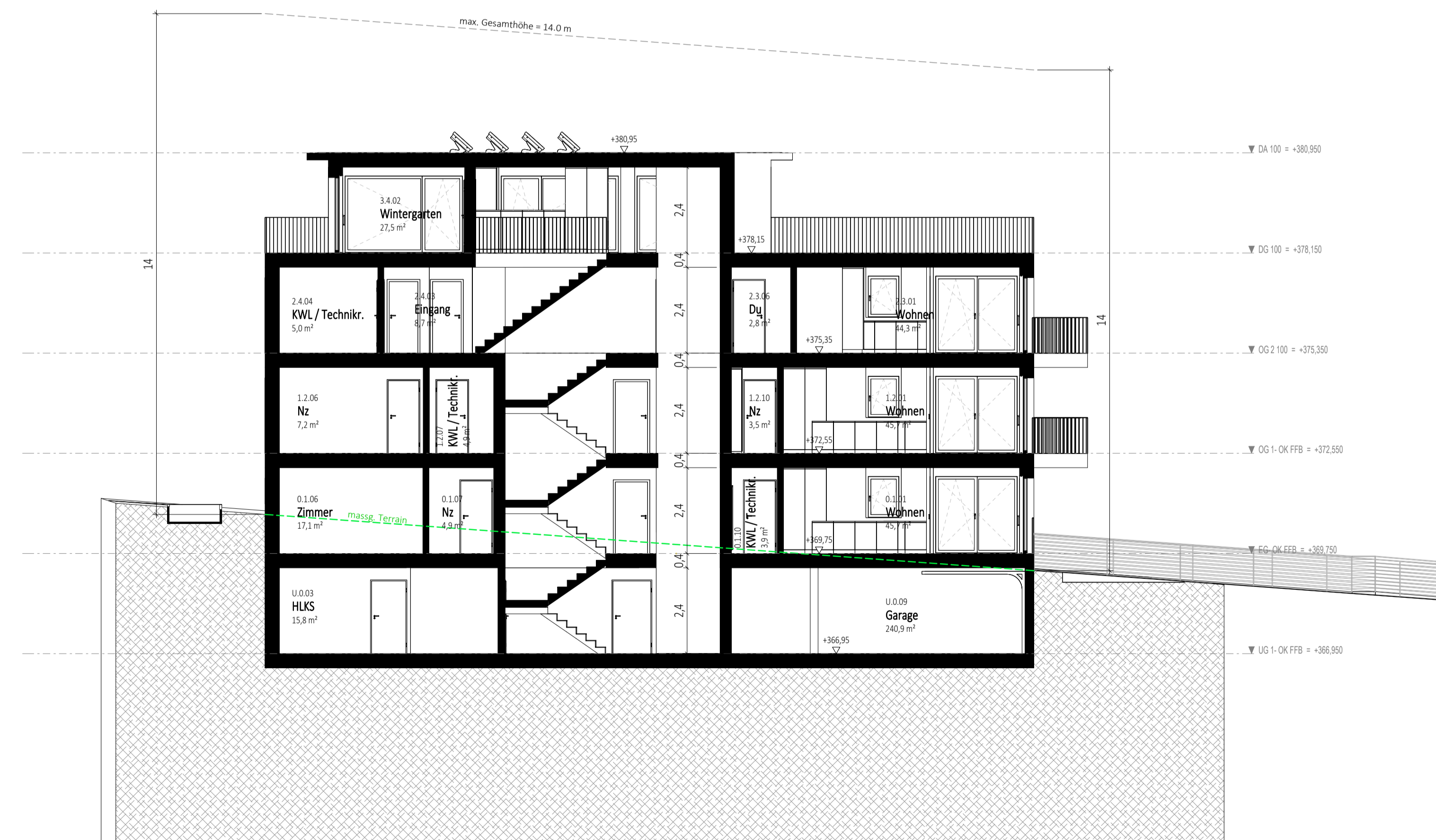
Schnitt V01 M 1 : 100