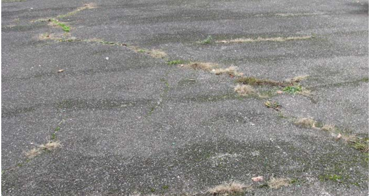
Abb. 5.13 Sanierungsbedürftiger Asphaltbelag Bezirksschulhaus Zelgli Zustand des Allwetterplatzes auf der unteren Terrasse des Bezirksschulhauses Zelgli.