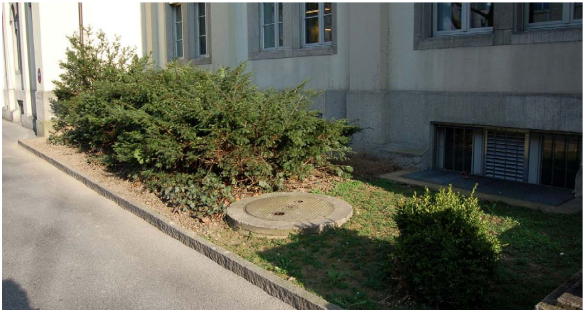
Abb. 5.2 Fassadenbegleitende Zierstrauchpflanzung am Pestalozzischulhaus

Diese Staudenpflanzungen in der Oberen Vorstadt sollten wieder ergänzt werden.