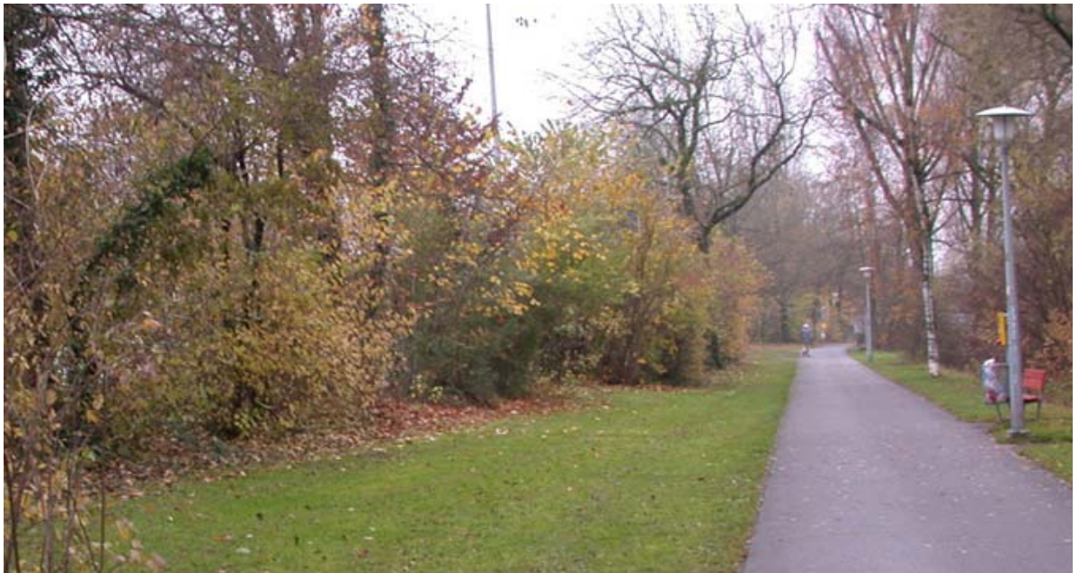
Abb. 5.9 Feldhecke am Aareufer Ost

Diese Heckenpflanzung schirmt zwar das Aareufer vom Strassenraum ab, verhindert aber auch den wichtigen Blickbezug zur Altstadt.