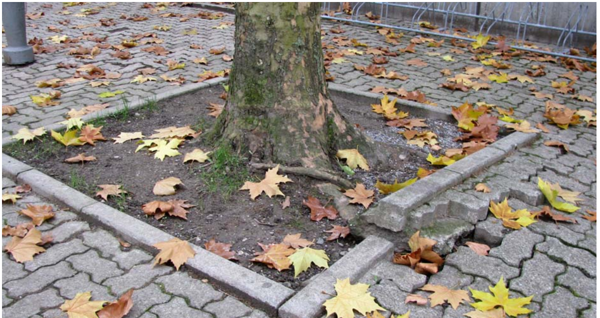
Abb. 5.11 Belagsschäden am Oberstufenschulhaus

Diese Probleme können nur mit einer grundlegenden Sanierung der Baumstandorte behoben werden.