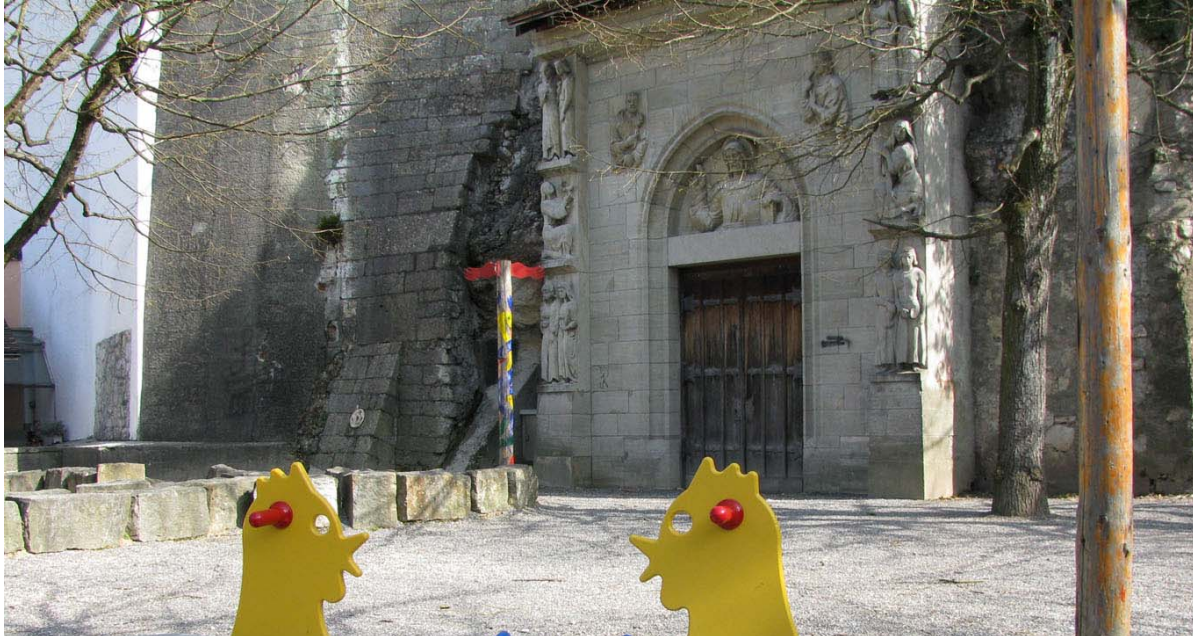
Abb. 5.22 Problematische Platzierung von Spielgeräten Marterpfähle vor dem Skulpturenportal des Bildhauers Spörri im Spittelgarten.