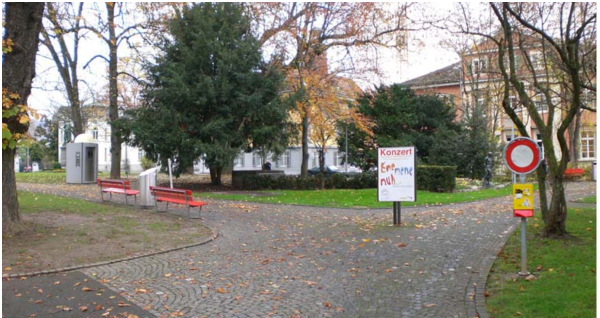
Abb. 5.19 Ansammlung von Ausstattungselementen

Die Platzierung der Elemente im Entréebereich des nördlichen Kasinogartens folgt keiner gestalterischen Konzeption.