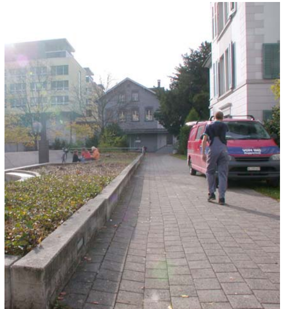
Abb. 5.16 Belag und Hochbeet an der Zurlindenvilla Heute STV