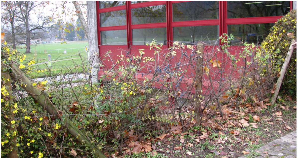
Abb. 5.20 Fehlende Absturzsicherungen am Oberstufenschulhaus

Dieser Zustand ist weder sicherheitstechnisch noch gestalterisch zufriedenstellend.