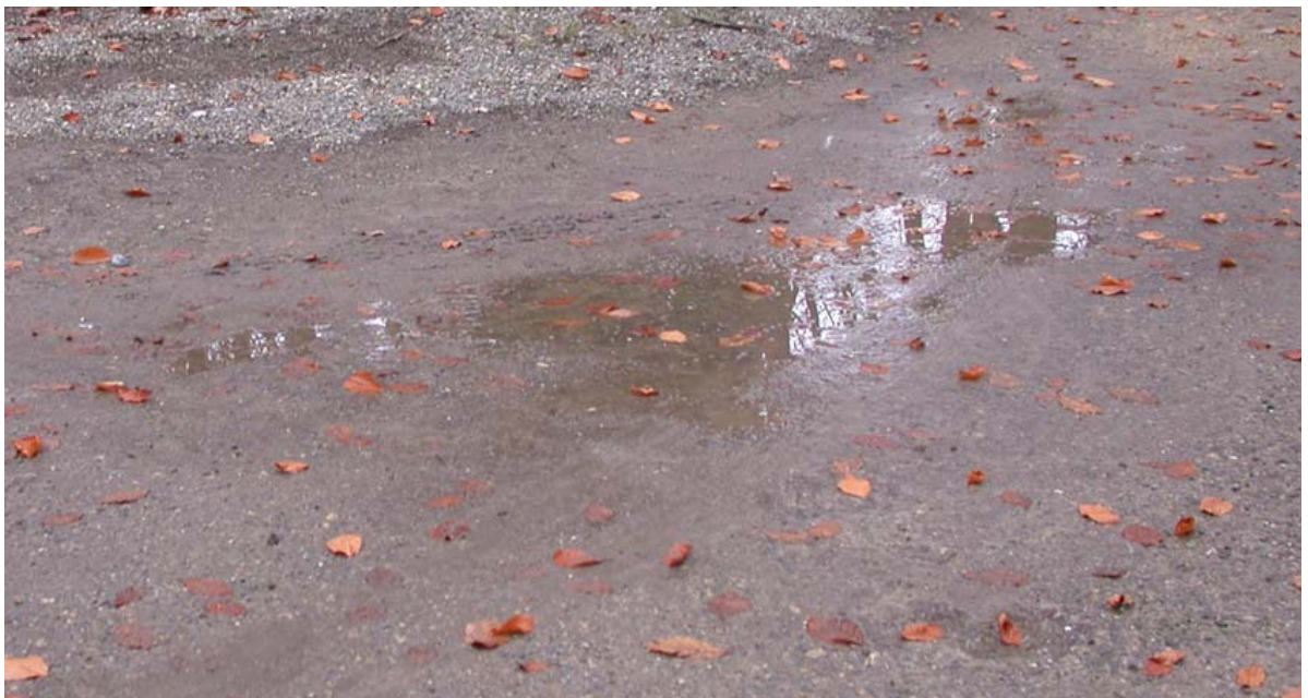
Abb. 5.12 Sanierungsbedürftige Chaussierung

Aktueller Zustand der Chaussierungen im Spielplatz Scheibenschachen