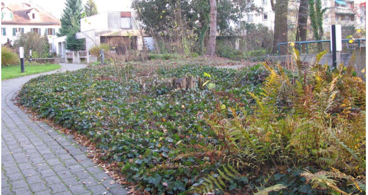
Abb. 5.3 Lückenhafter Gehölzgürtel im Alterszentrum Herosé

Dieser Abschnitt des Gehölzgürtels sollte wieder ergänzt werden, da er die Blickachse von der Villa räumlich abschliesst.