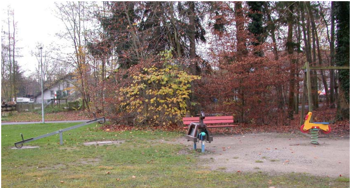
Abb. 5.21 Platzierung der Spielgeräte ohne gestalterische Einbindung Aktuelle Situation in der Spielanlage Scheibenschachen.