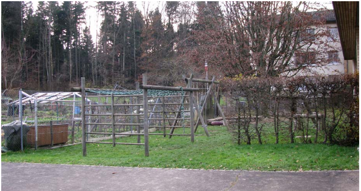
Abb. 5.25 Klettergeräte ohne Fallschutzbelag

Aktueller Zustand im Kindergarten Goldern.