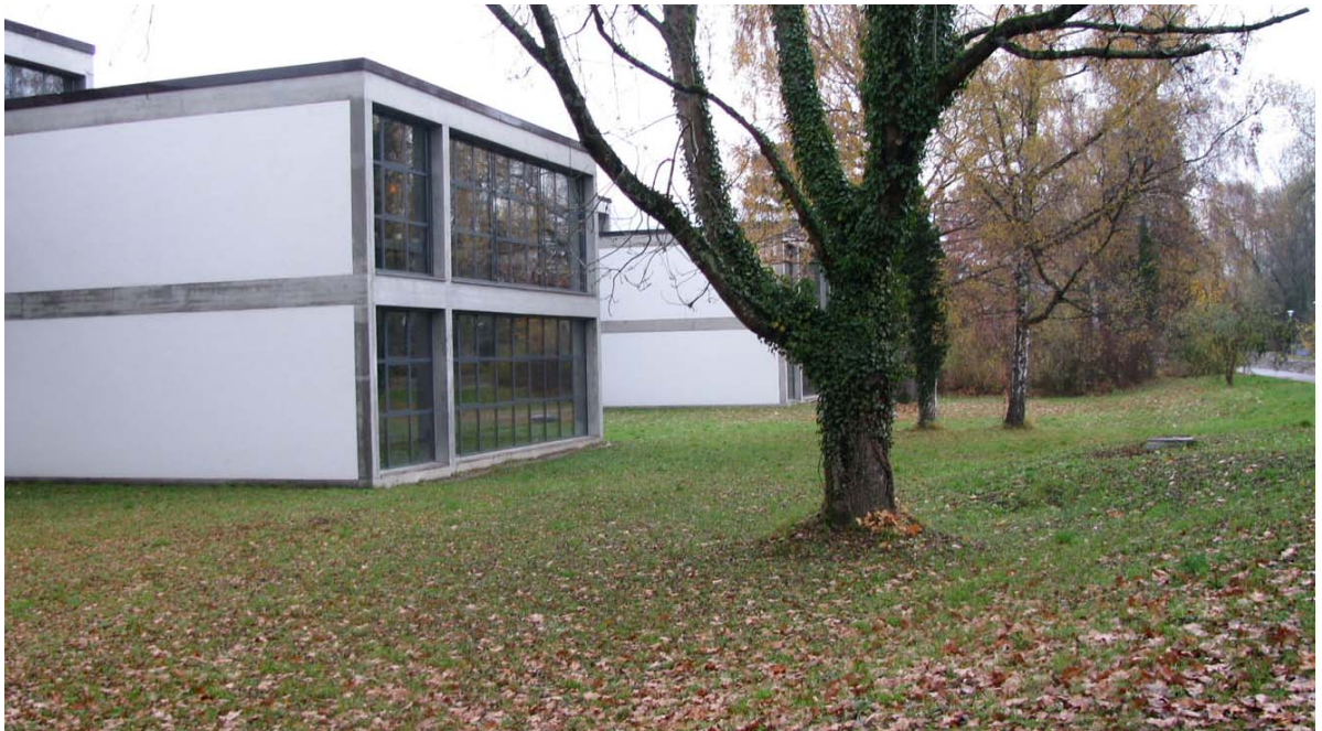
Abb. 5.7 Wiesen vor dem Aareschulhaus

Hier kommen Orchideenbestände vor, die mit einer extensiven Wiesenpflege gefördert werden sollten.