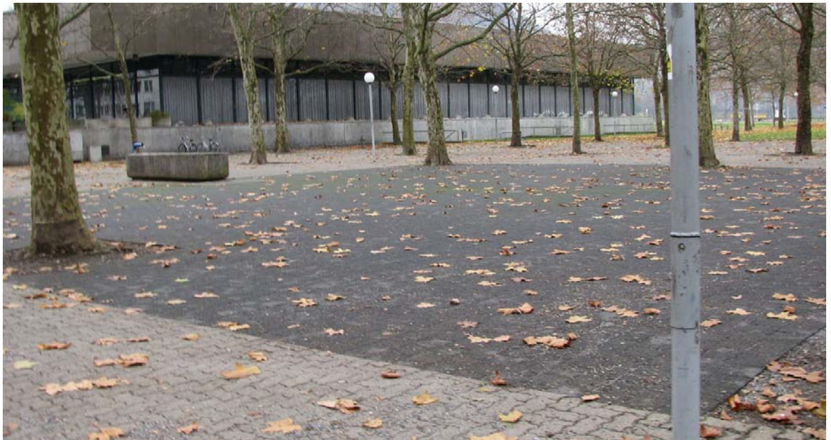
Abb. 5.17 Maienzugplatz

Der Maienzugplatz soll im Rahmen des Architekturwettbewerbs zur Sporthalle Schachen ebenfalls untersucht werden.