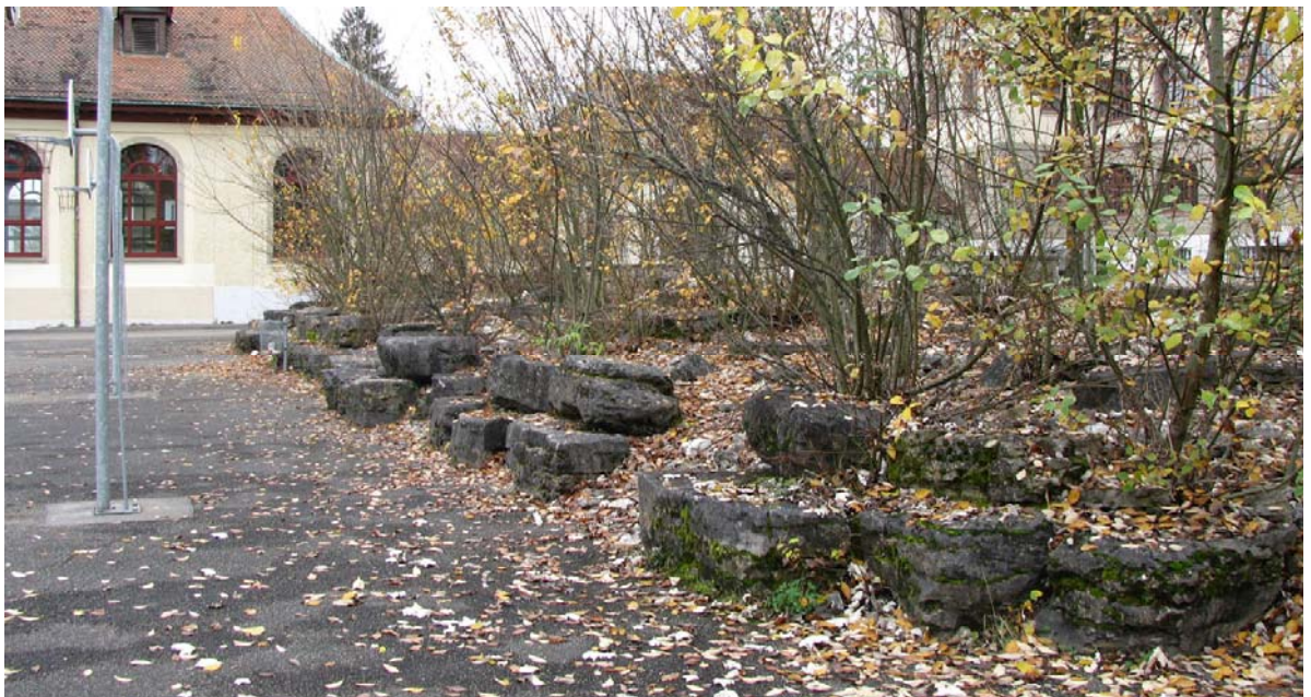
Abb. 5.14 Geröllschuttbiotop Bezirksschulhaus Zelgli Dieses Biotop ist in der Hauptachse der Anlage fehl am Platz.