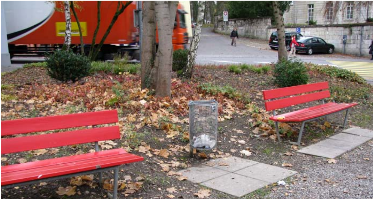
Abb. 5.1 Staudenpflanzung mit Substanzverlusten

Diese Staudenpflanzungen in der Oberen Vorstadt sollten wieder ergänzt werden.