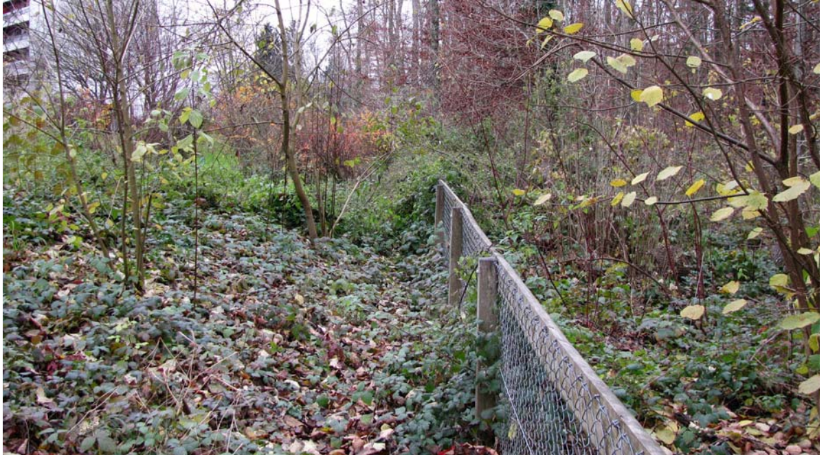
Abb. 5.4 Verwilderung von Pflanzungen

Brombeeren greifen vom Sommergriener auf die Pflanzungen des Kindergarten Telli über.