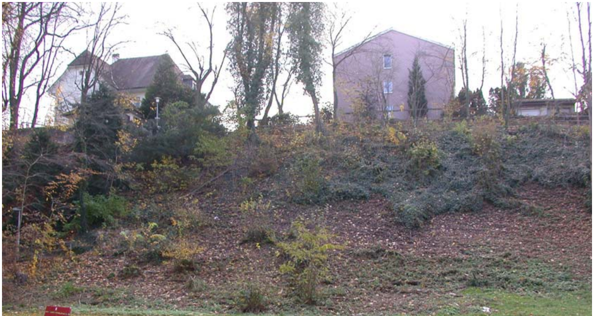
Abb. 5.10 Sichtfenster am Balänenweg

Die bislang vorgenommen Kahlschläge führen zu einem unattraktiven Vegetationsbild, das von Brombeeren dominiert wird und Neophyten wie die Robinie begünstigt.