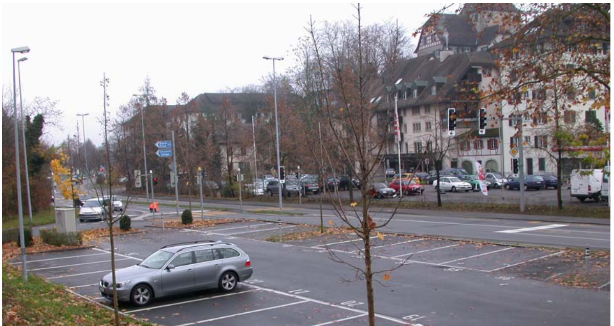
Abb. 5.18 Parkieranlagen im Mühlematt

Diese Anlagen verknüpfen die repräsentative Freiraumachse Graben-Schlossplatz mit dem Aareufer und sollten hochwertiger gestaltet werden.