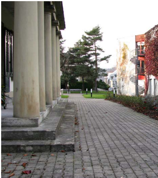
Abb. 5.15 Belag um die Villa Herzoggut Heute Alterszentrum Herosé