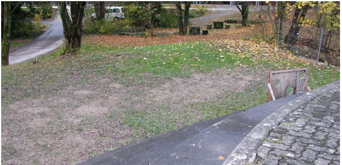
Abb. 5.6 Trittschäden beim Telliplatz

Hier sollte der Rasen durch einen strapazierfähigeren Schotterrasen ersetzt werden, da das Problem auch mit wiederholten Ausbesserungen nicht in den Griff zu bekommen wäre,