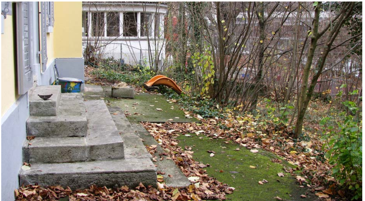
Abb. 5.5 Verwilderung und Belagsschäden im Kinderhort Chinderhuus

Brombeeren greifen vom Sommergriener auf die Pflanzungen des Kindergarten Telli über.