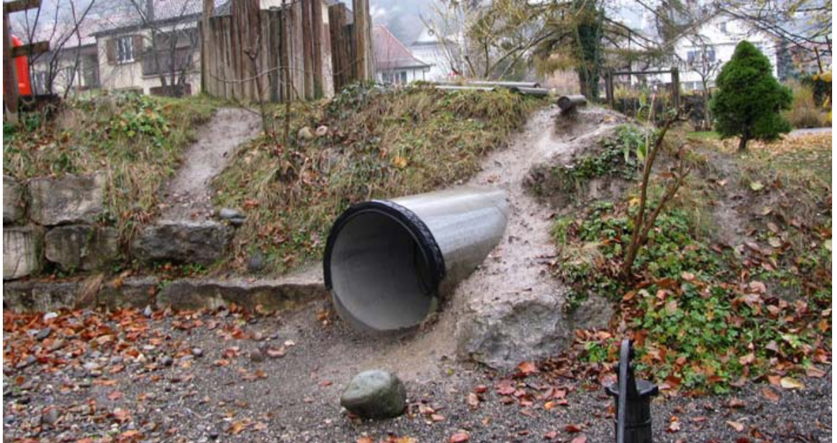
Abb. 5.23 Spielhügel im Kindergarten Scheibenschachen

Die Unfallgefährdung an diesem Spielhügel ist unübersehbar. Hier sind Sanierungsmassnahmen erforderlich.