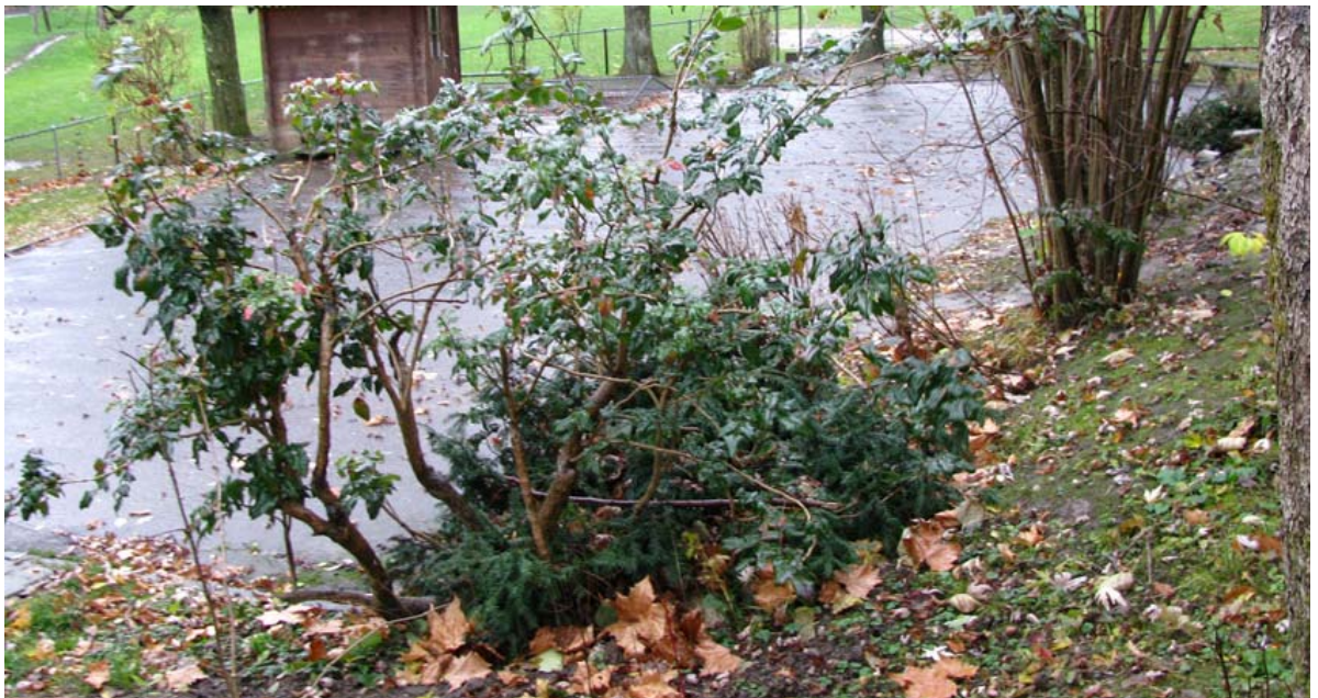
Abb. 5.24 Zierstrauchpflanzungen im Kindergarten Binzenhof

Die Unfallgefährdung an diesem Spielhügel ist unübersehbar. Hier sind Sanierungsmassnahmen erforderlich.