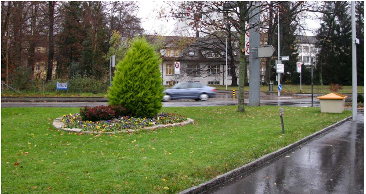
Abb. 5.8 Wechselflorrabatte im Neugut

Auf der Grünfläche im Neugut kann diese Wechselflorrabatte wenig zur stadträumlichen Qualität beitragen. Hier wäre mit einer Baumgruppe mehr zu erreichen.