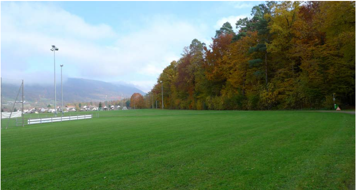
Abb. 4.5 Waldrandbereiche Gemeindepportanlage 'Im Winkel'

Zwergkoniferen auf Schotterflächen sind der Ortsbildgestaltung im ländlichen Raum nicht angemessen und auf Dauer auch nicht pflegeleicht.