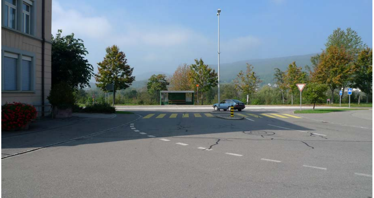
Abb. 4.11 Kreuzung am Gemeindehaus

Die Bedeutung der Ortsmitte ist in der Freiraumgestaltung nicht angemessen ausgedrückt.