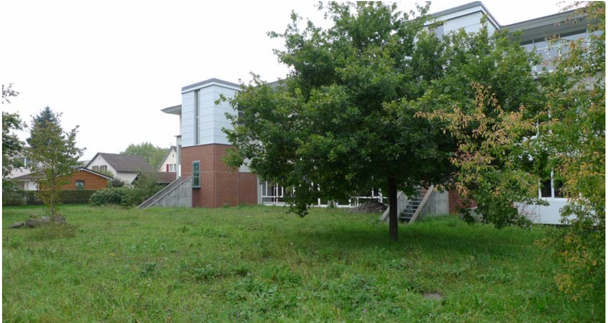
Abb. 4.2 "Naturwiese" südlich Schulhaus Sträppli

Da der Schulhof den Nutzungsdruck aufnimmt, kann die Fläche südlich des Schulhauses naturnah gepflegt werden.