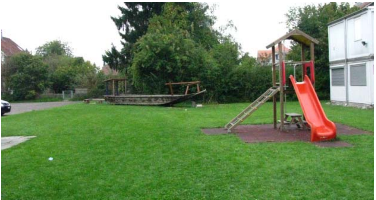
Abb. 5.17 Kindergarten Brunnbach

die Platzierung der Spielgeräte folgt keiner räumlichen Konzeption. Die Fläche geht nahtlos in den Parkplatz über.