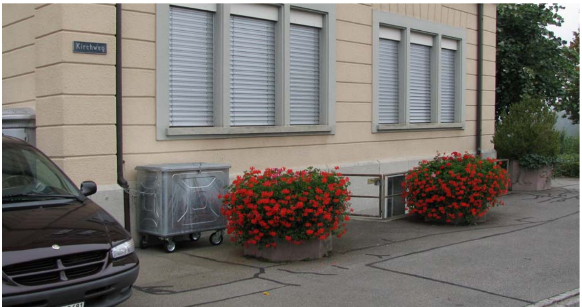
Abb. 4.12 Gemeindehaus-Vorplatz am Kirchweg

Die Bedeutung der Ortsmitte ist in der Freiraumgestaltung nicht angemessen ausgedrückt.