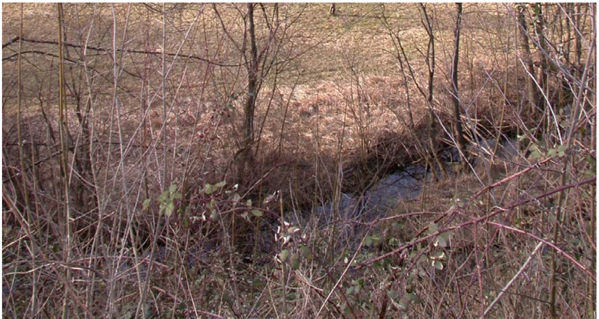
Abb. 4.7 Sichtfenster Schachenbalkon

Mit regelmässigen Auslichtungsmassnahmen soll das Sichtfenster offengehalten werden, Kahlschläge sind zu vermeiden.