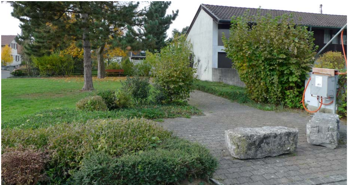
Abb. 5.10 Grünfläche Ausserfeldstrasse

Teilweise erfolgt der Formschnitt hier auch, um die Gehölze niedrig und die Sicht an der Kreuzung freizuhalten. Auf die Rabatte kann verzichtet werden.