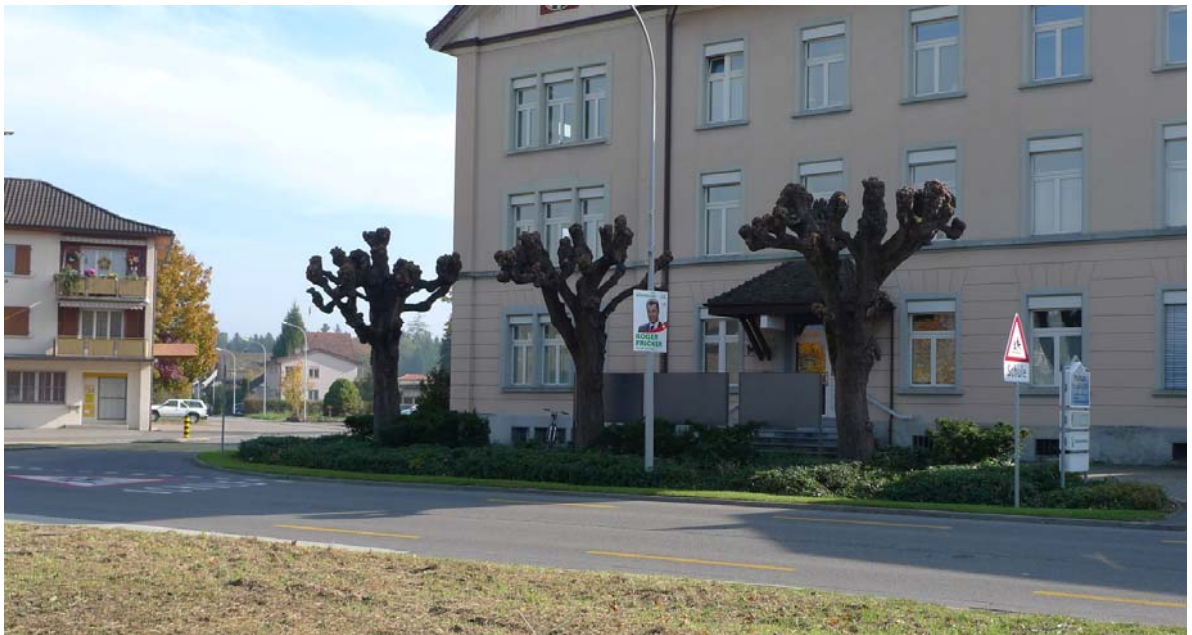
Abb. 4.10 Rabatte am Gemeindehauseingang

Es wird deshalb vorgeschlagen, die Gestaltung des Gemeindehausvorplatzes im Kontext einer weiter gefassten Lösung zu untersuchen, welche die gesamte Kreuzungssituation mit dem Vorplatz Post, der aktuell gross dimensionierte Einmündung Kirchweg und dem "Schachenbalkon" einschliesst. Für die Ausarbeitung der Massnahmen ist eine detaillierte Planung erforderlich.