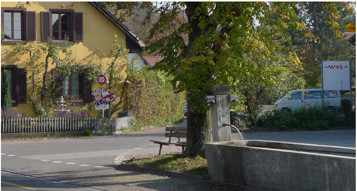
Abb. 4.1 Haltestelle Unterdorf

Es bestehen keine Mängel oder nur geringe Pflegemängel, welche durch den Pflegeunterhalt regelmässig behoben werden. Oft finden sich hier Ansätze in der Gestaltung und Pflege, die für andere Anlagen vorbildhaft sein könnten. Dies trifft in Rohr auf eine Vielzahl kleinerer Flächen im Verkehrsraum zu, die naturnah gepflegt werden, wenn die Erholungsfunktion zurücksteht oder umgekehrt auch eine angemessene Zuwendung erfahren, wenn sie wichtige Merkzeichen oder Treffpunkte im Strassenraum darstellen (z.B. Haltestelle Unterdorf). Aber auch die Umgebung der Kirche und ein Grossteil der Gemeindefreizeitanlage zählen zu den einwandfrei gepflegten Anlagen. An der Naturwiese südlich des Schulhauses Stäppli ist positiv herauszustellen, dass die gärtnerische Zuwendung mit einem Sauberkeitsstreifen entlang der Wege signalisiert wird.