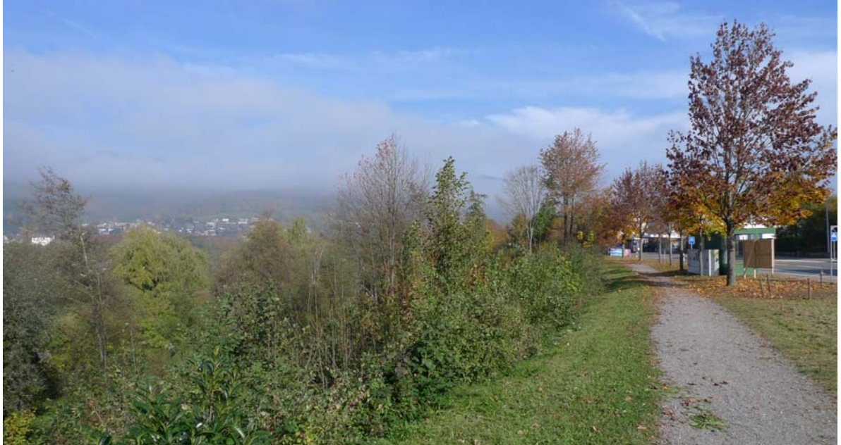
Abb. 4.6 Sichtfenster Schachenbalkon

Mit regelmässigen Auslichtungsmassnahmen soll das Sichtfenster offengehalten werden, Kahlschläge sind zu vermeiden.