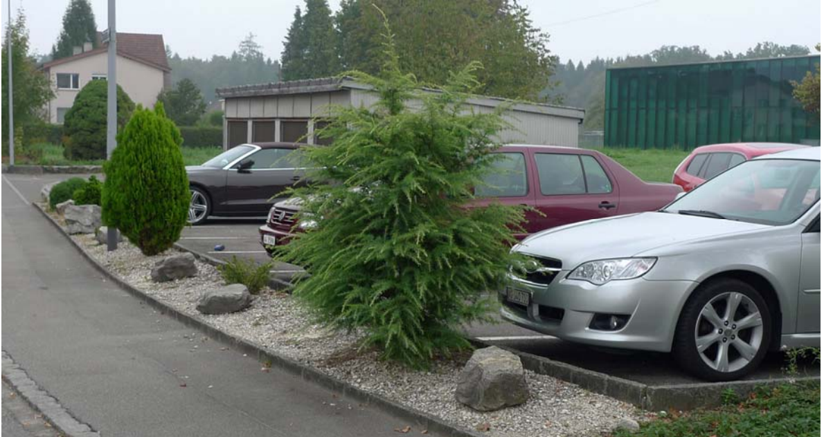
Abb. 4.4 Parkplatz am Gemeindehaus

Zwergkoniferen auf Schotterflächen sind der Ortsbildgestaltung im ländlichen Raum nicht angemessen und auf Dauer auch nicht pflegeleicht.