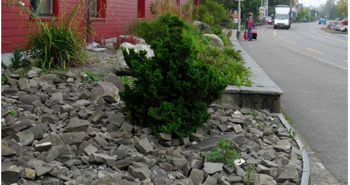
Abb. 5.1 Schotterpflanzung am Schulhaus Brunnbach

Solche Rabatten sind nur vorübergehend pflegeleicht und sollten nicht zum ortsbildprägenden Element werden.