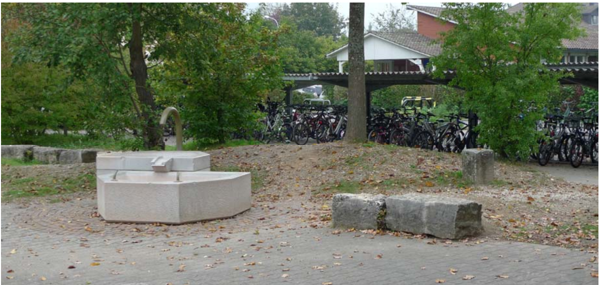
Abb. 4.9 Schulhof Stäppli

Hier wird die Pflanzung schnellwüchsiger Baumarten und einer Hecke als Abgrenzung zum Kindergarten vorgeschlagen.