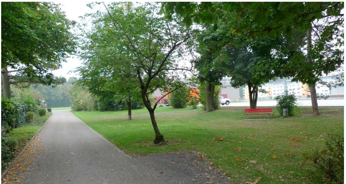
Abb. 5.16 Grünanlage am Friedhof

Die Platzierung der Ausstattungselemente folgt keiner gestalterischen Konzeption.