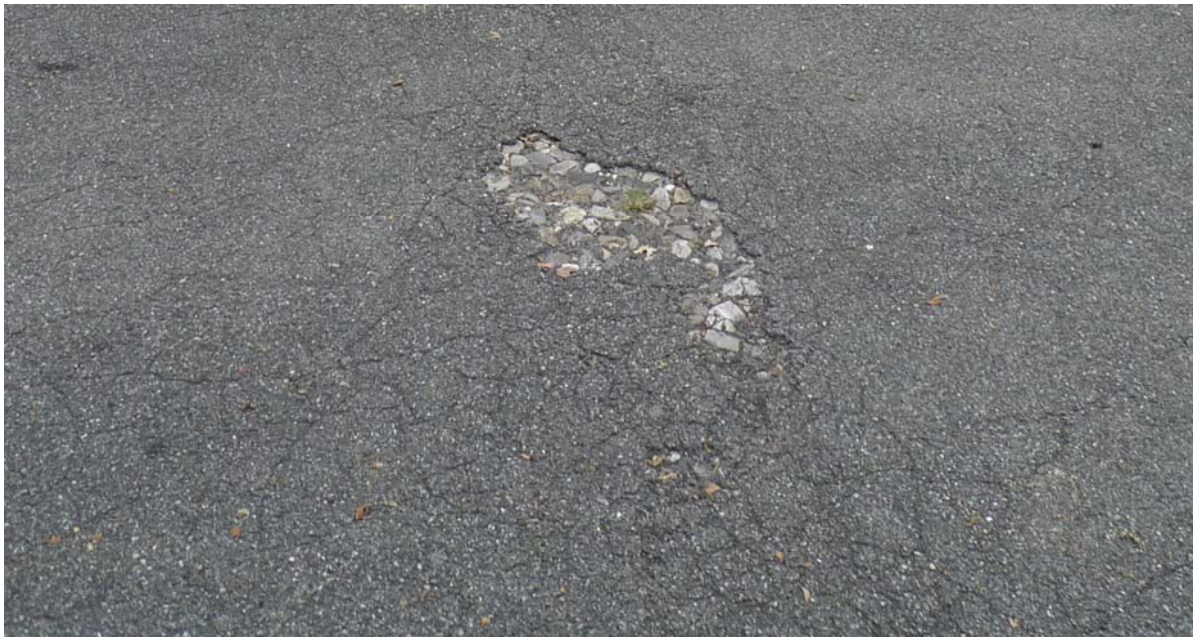
Abb. 5.13 Sanierungsbedürftiger Asphaltbelag an der Auenhalle (Schulhaus Brunnbach und Stäppli)