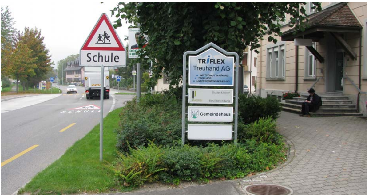
Abb. 5.2 Rabatte am Gemeindehauseingang

Solche Rabatten sind nur vorübergehend pflegeleicht und sollten nicht zum ortsbildprägenden Element werden.