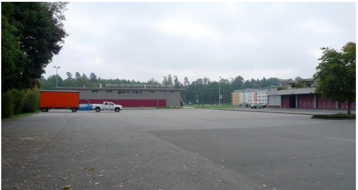
Abb. 5.15 Parkierungsanlagen am Friedhof

Dieser Parkplatz ist ausserordentlich gross und sollte genügend Raum für Baumpflanzungen bieten.