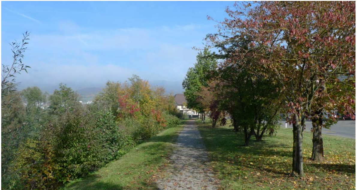
Abb. 4.3 "Schachenbalkon"

Wie ein Vorhang, der sich zum Sichtfenster öffnet: Die Gehölzaufreihung entlang des Fahrbahnrandes. Die Wiesen und Blumenrasen im Unterwuchs werden extensiv gepflegt und sind recht artenreich.