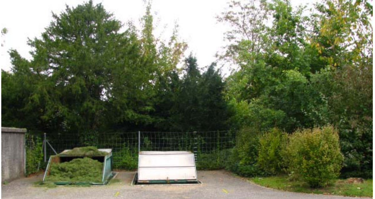
Abb. 5.5 Gehölzpflanzungen am Friedhof

Mit einer sorgfältig überlegten Staffelung der Gehölzarten könnte eine interessante Kulisse geschaffen werden, die abschirmt ohne abzuriegeln.