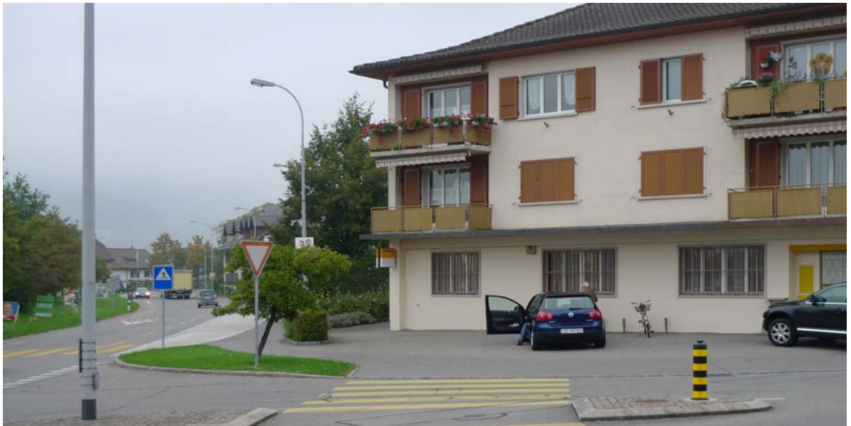
Abb. 5.3 Vorplatz Post

Dieser Ort würde einen grösseren Baum vertragen.