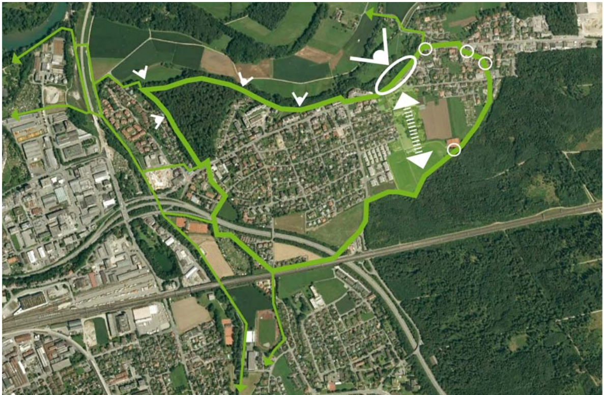
Abb. 1.1 Skizze zum Freiraumgefüge

Rohr verfügt über ein interessantes Freiraumgefüge, das seine Qualitäten insbesondere im Bezug auf das sehr attraktive landschaftliche Umfeld erfährt. Von der Entwicklung dieses Freiraumgefüges sind mehrere Trägerschaften betroffen: neben der Stadt Aarau auch der Kanton, die IBAarau sowie die Nachbargemeinden Suhr und Buchs. Zwischen dem Waldgebiet "Im Winkel" und dem Gemeindehaus reihen sich die wichtigsten Freiräume zum zentralen Grünzug auf. Am Gemeindehaus mündet diese Achse auf den "Schachenbalkon", eine schmale ,entlang der Hochterrasse verlaufende Grünanlage, die eine der schönsten Aussichten auf die Jurahügelkette zeigt. Von hier aus spannen sich in weiten Bögen zwei attraktive Wegeverbindungen am Siedlungsrand, die kleinere Grünflächen, Brunnen oder schöne Aussichtspunkte auffädeln: Im Osten über die Lindenstrasse und dann entlang des Waldrandes; im Westen der Hochterrassenkante entlang zum Quellhölzli und dann der Suhre bzw. ihren Niederterrassenkanten entlang. Hier sind sichere Strassenquerungen zu gestalten, Aussichtspunkte zu entwickeln, Signalisation und Bänke zu ergänzen.