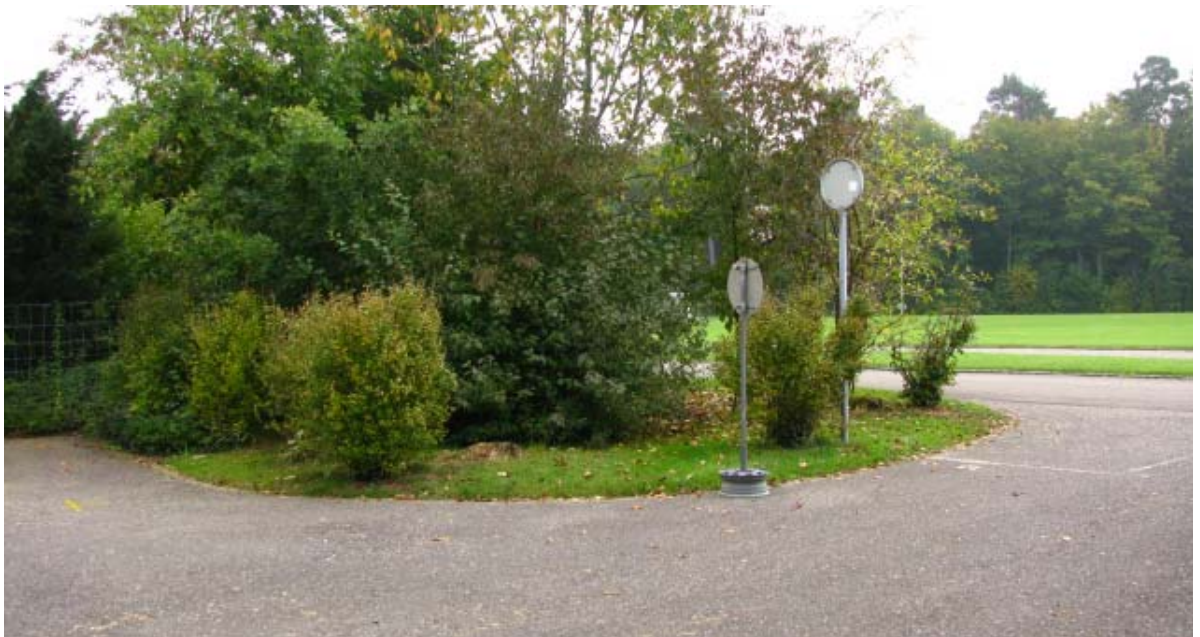
Abb. 5.6 Gehölzpflanzungen am Friedhof

Mit einer sorgfältig überlegten Staffelung der Gehölzarten könnte eine interessante Kulisse geschaffen werden, die abschirmt ohne abzuriegeln.