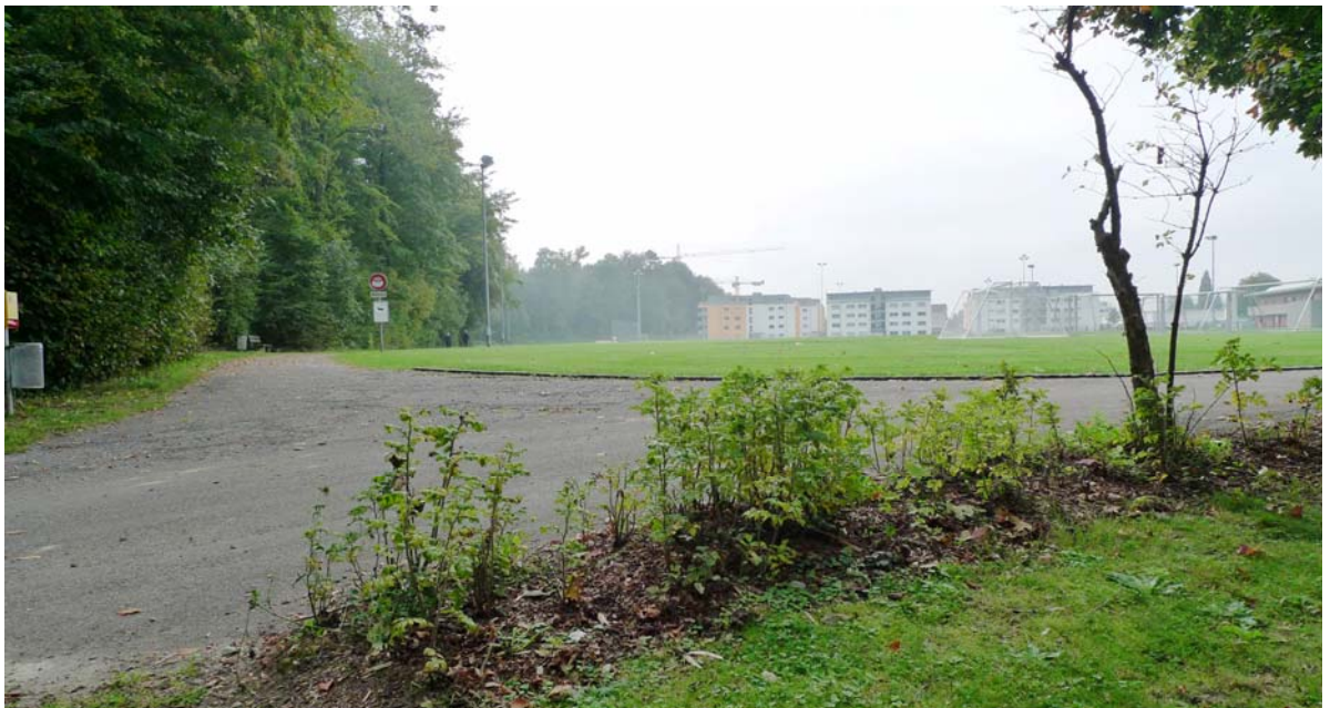
Abb. 5.11 Apfelrosenpflanzung an der Raststelle im Winkel

Die Pflanzung ist nicht notwendig und standortfremd.