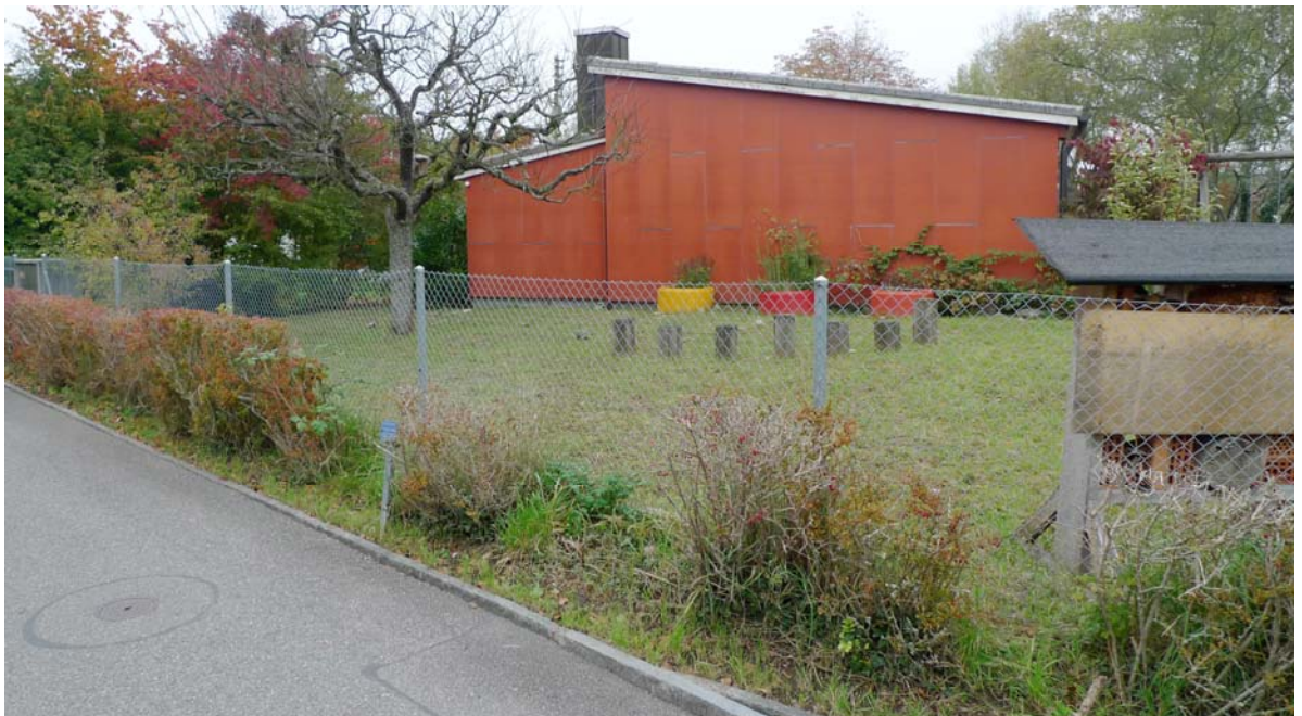
Abb. 5.7 Kindergarten Neudorfstrasse

Vermischung von Schnittheckenfragmenten mit Wildstaudensaum.