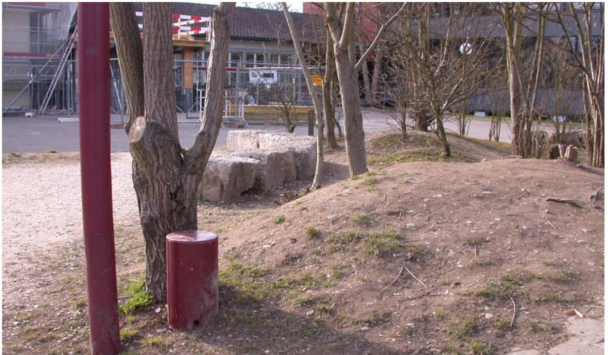
Abb. 5.8 Schulhof Brunnbach und Stäppli

Hier sollte der Rasen durch strapazierfähige Schottersubstrate mit Trittpflanzen- und Pioniergesellschaften ersetzt werden, da das Problem auch mit wiederholten Rasenausbesserungen nicht in den Griff zu bekommen wäre,