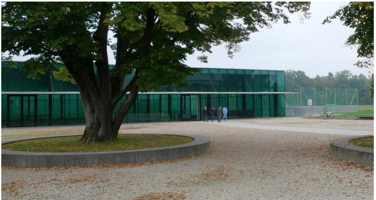
Abb. 5.12 Doppelsporthalle

Die Chaussierung an der Doppelsporthalle ist teilweise vergrast. Sie sollte gesäubert und egalisiert werden.