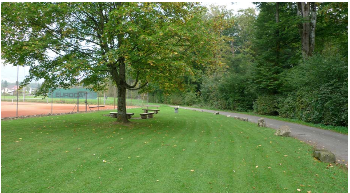
Abb. 5.9 Raststelle am Tennisplatz

Der grösste Teil der am Waldrand liegenden Fläche könnte als Wiese gepflegt werden.