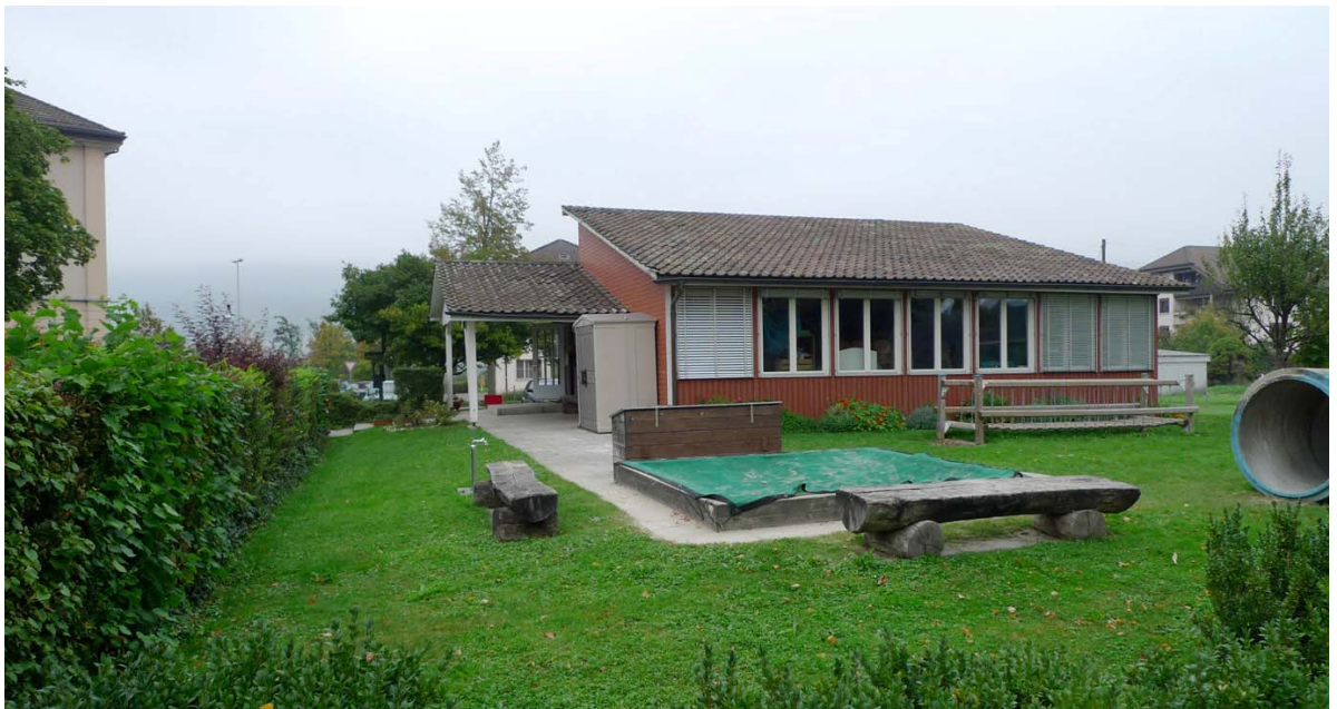
Abb. 5.4 Kindergarten Kirchweg

Die Hecke ist mit Fremdpflanzen durchsetzt.