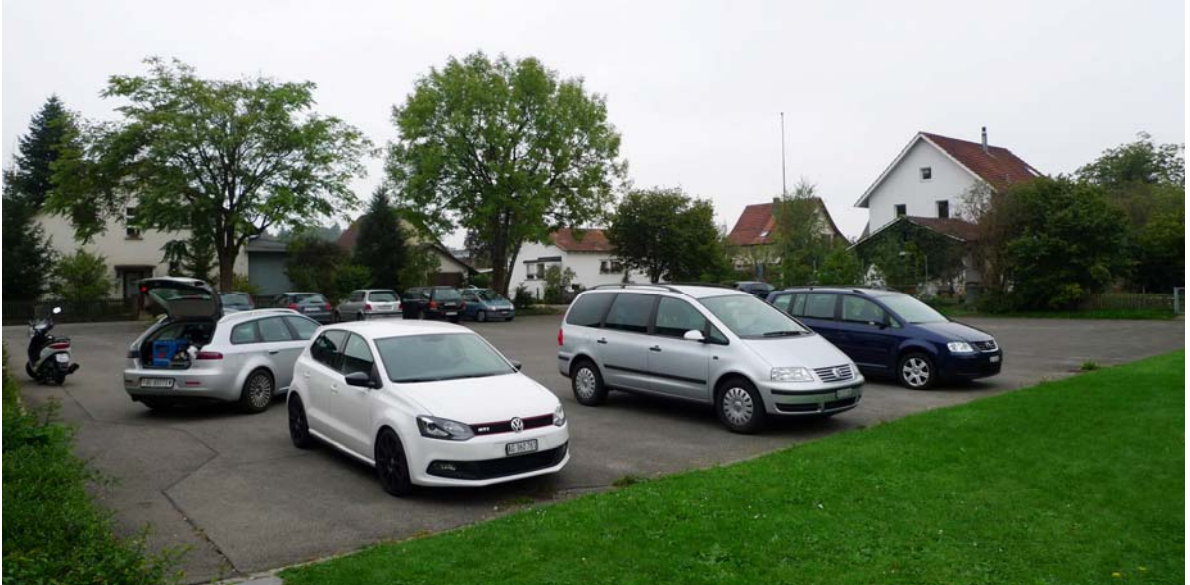
Abb. 4.8 Parkplatz Schulhaus

Hier wird die Pflanzung schnellwüchsiger Baumarten und einer Hecke als Abgrenzung zum Kindergarten vorgeschlagen.