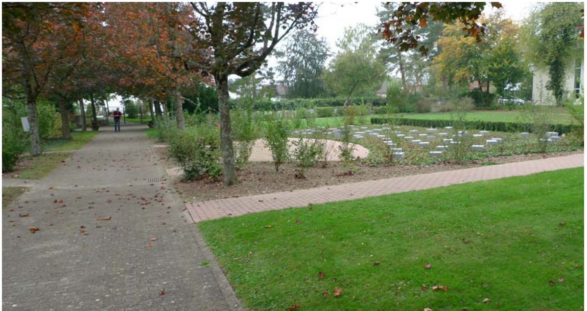
Abb. 5.14 Urnenfeld im Friedhof Rohr

Der Friedhof Rohr wurde ursprünglich nach den Plänen der Zürcher Landschaftsarchitekten Mertens + Nussbaumer 1959-1960 gestaltet. Pflege und gestalterische Entwicklung sollten den historischen Kontext respektieren. Dies ist nicht immer erfolgt, wie auf den ersten Blick schon das Belagspuzzle im Bereich des Urnenfeldes zeigt. Die Originalpläne befinden sich im Archiv für Schweizerische Landschaftsarchitektur (ASLA); Altes Verzeichnis Nr. 5176, 5185, 5186, 5186A, 5208, 5208A, 5342, 5242A, 5242B, 5242C, 5242D.