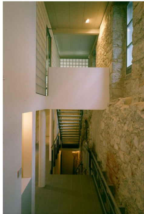
"alte Grabenmauer" im Treppenhaus