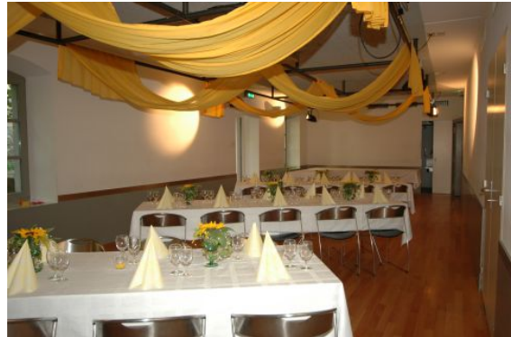
Mehrzwecksaal, 2. Untergeschoss