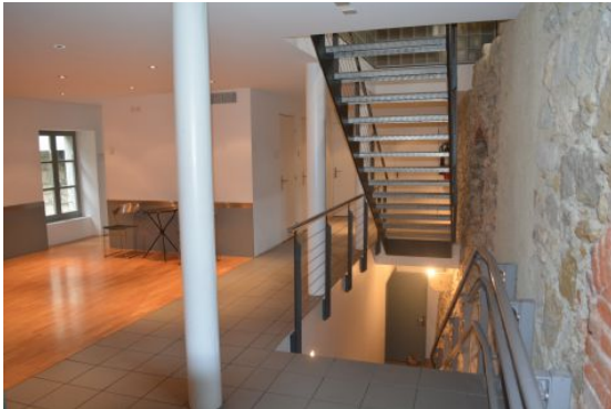
Foyer, 1. Untergeschoss

Das Landjägerwachthaus beherbergt im 1. und 2. Untergeschoss unter dem Begriff "Roschtige Hund" multifunktional nutzbare Räume, bestehend aus einem Foyer, einer Küche und einem Mehrzwecksaal. Die Räume werden an Vereine, Handel, Industrie und Gewerbe, aber auch an Private vermietet. Die über den Eingang am Ziegelrain 2 zugänglichen Räumlichkeiten eignen sich für Tagungs-, Schulungs- und Kursangebote, Versammlungen, Vorträge, Konzerte, Lesungen, Aufführungen oder Ausstellungen. Durch die Möblierung sind verschiedene Einrichtungs- und Bestuhlungsvarianten möglich. Dazu gemietet werden, kann die Audioanlage mit Video-Beam, die Lichtenanlage, der digitale Flügel, etc.