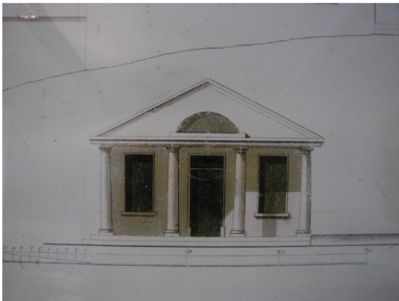
Hauptfassade (in der Tradition des Klassizismus)

Der Hauptbau besteht aus drei Geschossebenen, die alle bachseitig am Tageslicht liegen. Der eingefügte "Neubauteil" wurde als Massivbau mit Betondecke und Stützen sowie mit Backsteinwänden konzipiert. Die "alte Grabenmauer" wurde mit allen "Zeichen der Zeit" in ihrer natürlichen Form belassen bzw. konserviert, um dadurch ihre Geschichte zu veranschaulichen und ihren städtebaulichen Werdegang zu kennzeichnen.