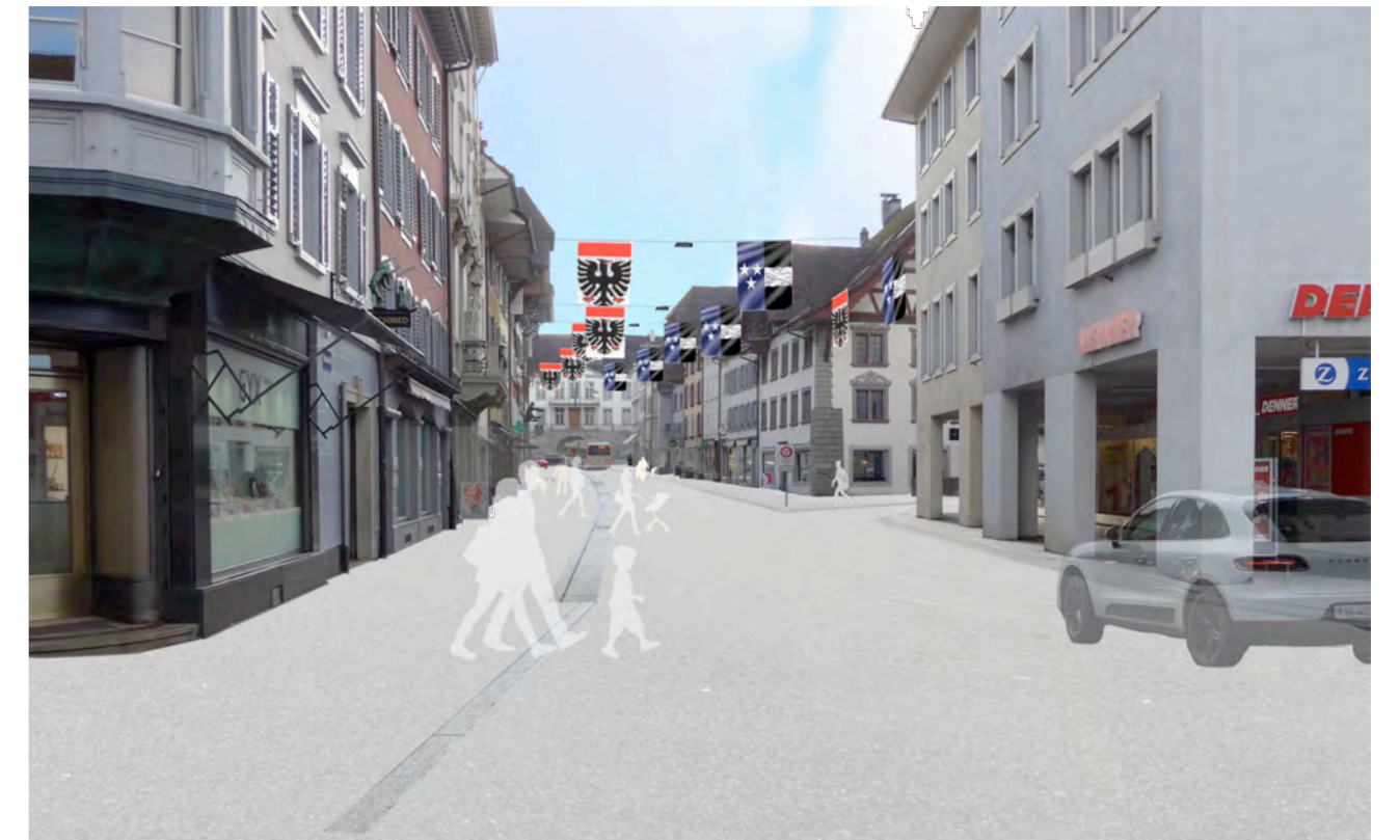
Einblick in Gassenraum