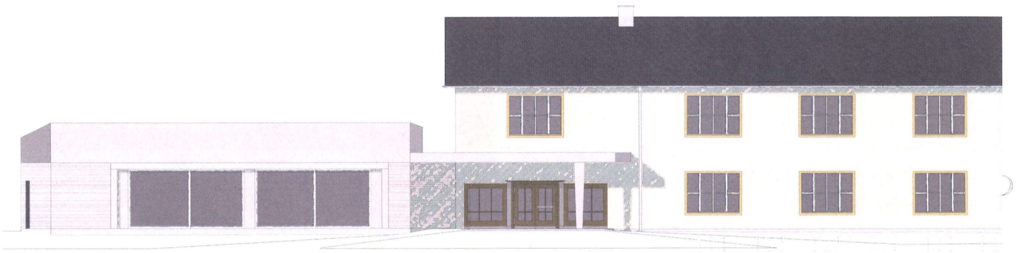
Ansicht Eingang Aula

mögliche, künftige Bedürfnisse sowie Optionen für künftige Strukturen offen gehalten.