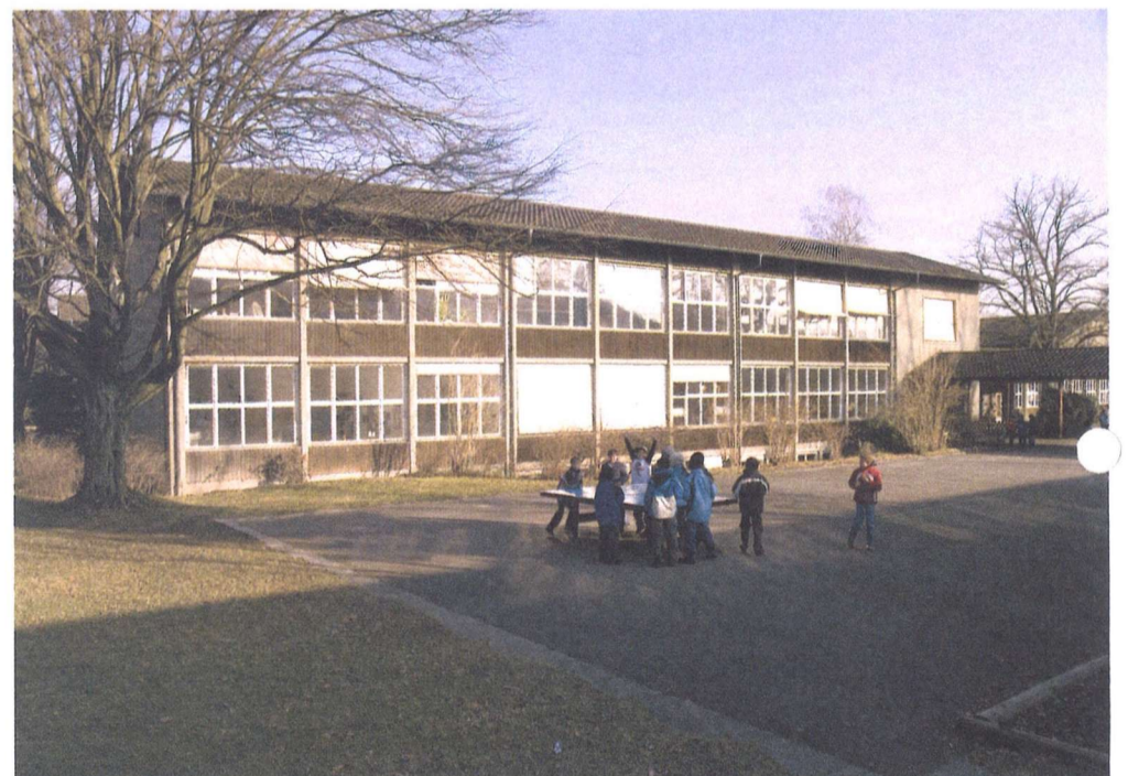
Ansicht des Schulhauses vom Pausenhof aus in seiner heutigen Erscheinung

Die Elektro- und Sanitärinstallationen aus den 50er-Jahren müssen grundlegend erneuert werden. Energieeffiziente Leuchten sollen in den Klassenzimmern jederzeit gute Lichtverhältnisse garantieren. Auch bei der Heizung muss die Leitungsführung im UG komplett ausgewechselt werden. Ein grosser Teil der Heiz-