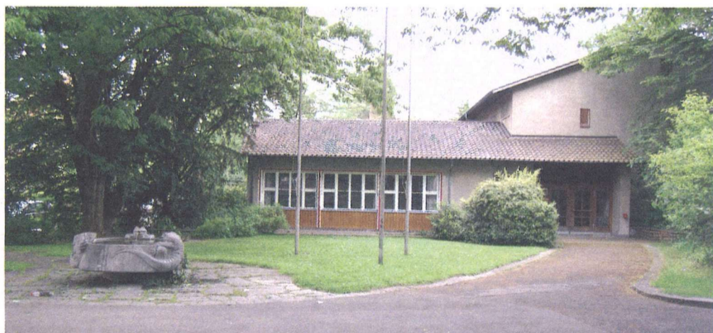
Ansicht vom Gönhardweg

Der Einwohnerrat hat am 15. Dezember 2008 die Vorlage des Stadtrates mit 47 Ja-Stimmen einstimmig bei einer Enthaltung gutgeheissen.